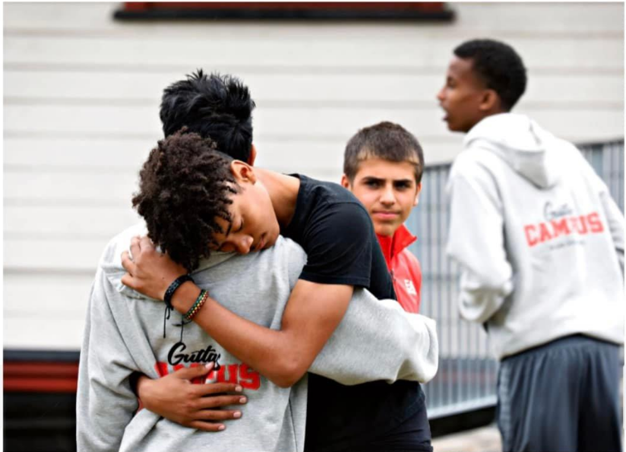
I løpet av campen opplever guttene ikke bare faglig og personlig utvikling, men også samhold og vennskap.