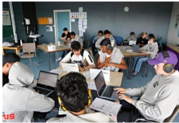
➍ De har fått et løft i lesing, skriving og regning