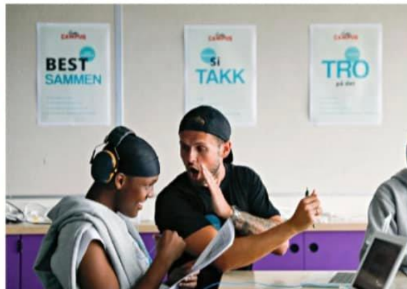
➋ Målet er å hjelpe guttene å mestre skolen og hindre frafall.